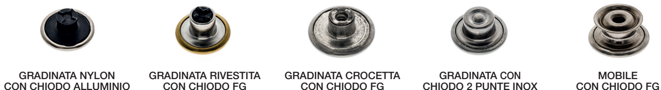
GRADINATA NYLON CON CHIEDO ALLUMINIO